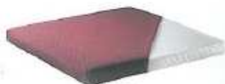
Artikel: 570 KlimaComfort