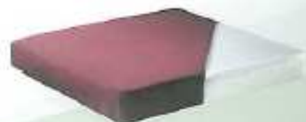
Artikel: 571 KlimaComfort PLUS†

Mit dem JOSITEX Sitzkissen KlimaComfort als Decubitus-Prägnisse hat die Zukunft des innovativen Klimakomforts begonnen. Auch ohne eine weitere mechanische Belüftung verbindet das JOSITEX Sitzkissen KlimaComfort exzellente Sitzverhältnisse mit hervorragender Wärme- und Feuchtigkeitsabfuhr bereits durch den nutzungsbedingten Lastwechsel und die dadurch ausgelösten (passiven) Pumpenwirkung. Möglich wird diese Balance von Wärme und Feuchte durch die einseitige Luftdurchlässigkeit des innovativen 3DEA-Abstandsgewirkes. Das 3DEA-Sitzkissen besteht aus einer technisch-textilen Ober- und Unterfläche, die durch druckelastische Monofilament-Fäden einen definierten Abstand zueinander aufweisen.